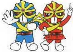
広島県警察反射材活用促進キャラクター「キラリ☆マン・キラリ☆ウーマン」